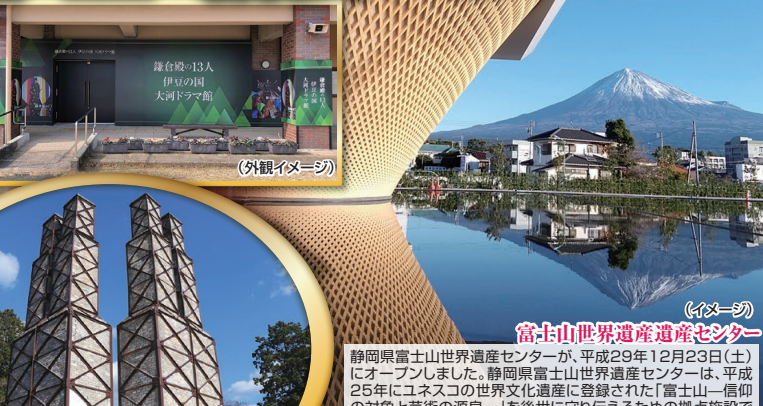
(イメージ) 富士山世界遺産遺産センター 静岡県富士山世界遺産センターが、平成29年12月23日(土)にオープンしました。静岡県富士山世界遺産センターは、平成25年にユネスコの世界文化遺産に登録された「富士山—信仰の対象と芸術の源泉—」を後世に守り伝えるための拠点施設です。富士ヒノキの木格子の外壁を持つ建物は「逆さ富士」を表現しており、前面の水盤に映る「富士山」の姿が現れます。